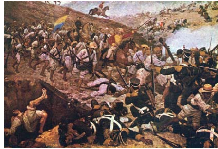
Batalla de Boyacá. Óleo de Martín Tovar y Tovar, París 1890.

su estado mayor de 39 oficiales y su comandante de las tropas Españolas, el coronel José María Barreiros.