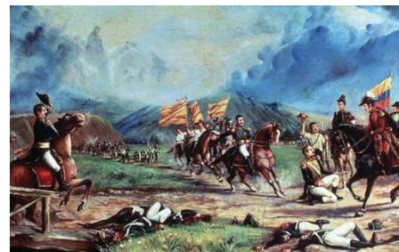
Batalla de Boyacá

Sí. En el 2019, es decir, dentro de dos años, estaremos conmemorando el Bicentenario de este acontecimiento histórico. La Campaña Libertadora de 1819 fue una insurrección cocinada en el fuego de la opresión, pero avivada por el amor terrígeno y el espíritu libertario de sus protagonistas. La contienda fue desigual. Se impusieron los bravos defensores de la independencia, inspirados en los legítimos derechos de igualdad y libertad. Ellos, semidesnudos y mal pertrechados, armados, a cuál más, de arrojo, valor y heroísmo se dieron sin condiciones a una causa noble y altruista. Lucharon para defender unas convicciones profundas, heredadas de sus ancestros indígenas y consolidar unos principios sustentados en la dignidad humana que habían inspirado la, por ese entonces, reciente Revolución Americana y del Caribe y la misma Revolución Francesa.