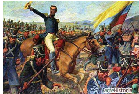
El Mariscal de Ayacucho, Imagen obtenida de: http://ismaelalejandromolina27.blogspot.com/

Para el sesquicentenario de la Campaña Libertadora se ejecutaron, entre otras, las siguientes obras: remodelación y embellecimiento de los monumentos de los campos del Puente de Boyacá y el Pantano de Vargas, en donde se levantó el imponente monumento escultórico del maestro Rodrigo Arenas Betancur, en homenaje a los 14 Lanceros; adquisición y remodelación de la Casa del Fundador de Tunja, Don Gonzalo Suárez Rendón; inauguración del Museo de Arte Colonial Religioso de Duitama; iniciación de la construcción de los estadios La Independencia de Tunja, Tundama de Duitama, El Sol de Sogamoso y el 9 de septiembre de Chiquinquirá; edición y reimpresión del Álbum de Boyacá del canónigo Cayo Leónidas Peñuela; construcción de la planta física de la Escuela Normal Superior “Leonor Álvarez Pinzón” de la ciudad de Tunja y construcción