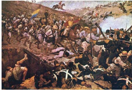
Batalla de Boyacá. Óleo de Martín Tovar y Tovar, París 1890.

La Campaña Libertadora fue una operación militar corta y osada. Solo transcurrieron 77 días entre la exposición del plan de guerra por parte del General Simón Bolívar a los comandantes de las tropas patriotas el 23 de mayo de 1819 en la aldea de los Setenta, a orillas del río Apure en Venezuela y la entrada memorable y sin resistencia el 10 de agosto del mismo año a Santafé de Bogotá, capital del Virreinato de la Nueva Granada, no sin antes haber combatido con fiereza y arrasado al enemigo en las batallas de Paya, Gámeza, Pantano de Vargas y Puente de Boyacá. Fueron apenas unos 2.200 soldados criollos, mestizos, mulatos, zambos, negros e indígenas los que emprendieron la jornada épica para enfrentar a un ejército de más de 4.500 soldados entrenados y bien pertrechados al mando del español José María Barreiro, sin hacer cuenta centenares más de soldados realistas pertenecientes a guarniciones cercanas a la Ruta Libertadora.