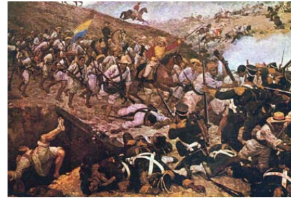
Batalla de Boyacá. Óleo de Martín Tovar y Tovar, París 1890.

La Campaña Libertadora fue una operación militar corta y osada. Solo transcurrieron 77 días entre la exposición del plan de guerra por parte del General Simón Bolívar a los comandantes de las tropas patriotas el 23 de mayo de 1819 en la aldea de los Setenta, a orillas del río Apure en Venezuela y la entrada memorable y sin resistencia el 10 de agosto del mismo año a Santafé de Bogotá, capital del Virreinato de la Nueva Granada; no sin antes haber combatido con fiereza y arrasado al enemigo en las batallas de Paya, Gámeza, Pantano de Vargas y Puente de Boyacá. Fueron apenas unos 2.200 soldados criollos, mestizos, mulatos, zambos, negros e indígenas los que emprendieron la jornada épica para enfrentar a un ejército de más de 4.500 soldados entrenados y bien pertrechados al mando del español José María Barreiro, sin hacer cuenta centenares más de soldados realistas pertenecientes a guarniciones cercanas a la Ruta Libertadora.