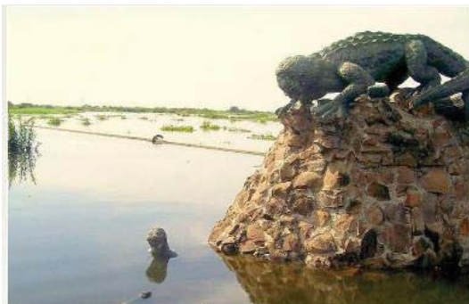
Caño de las mujeres en Plato.

Come queso y come pan, y toma tragos de ron”