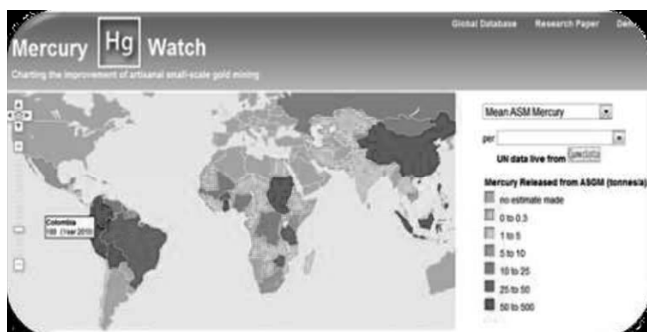
Tabla 1: LIBERACIONES DE MERCURIO POR ASGM

Según Mercurywatch 17 , organización que se dedica a la recolección, análisis y servir públicamente información sobre el mercurio que se libera al ambiente mediante la extracción minera de oro artesanal y en pequeña, Colombia es el segundo país a nivel mundial que más libera mercurio, debido a la minería aurífera artesanal y en pequeña escala (180 toneladas anuales a 2010) después de China (444,5 toneladas anuales a 2010).