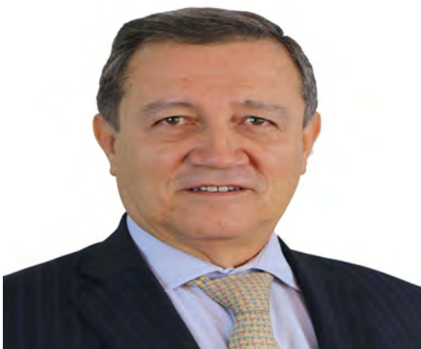
Honorable Senador Ernesto Macías Tovar Presidente del honorable Senado de la República

“Si así fuere que Dios, esta Corporación y el pueblo os los premien, y si no que Él y ellos os lo demanden” .