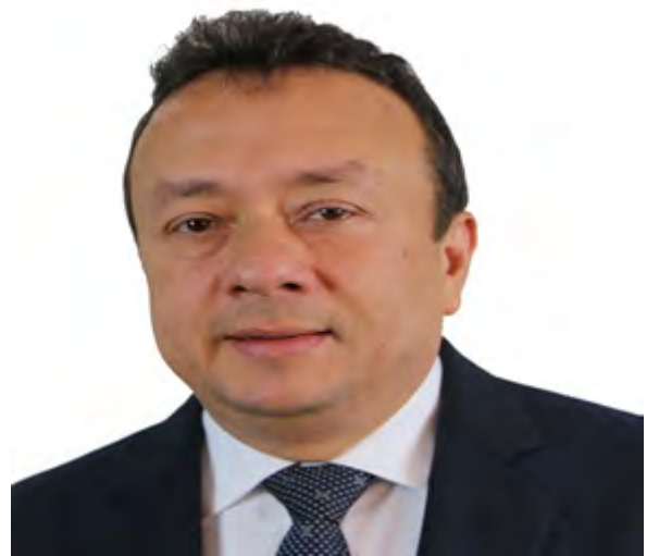
Honorable Senador Eduardo Pulgar Daza Primer Vicepresidente del honorable Senado de la República

“Si así fuere que Dios, esta Corporación y el pueblo os los premien, y si no que Él y ellos os lo demanden” .