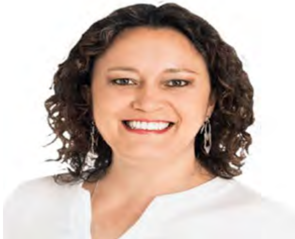
Honorable Senadora Angélica Lisbeth Lozano Correa

“Si así fuere que Dios, esta Corporación y el pueblo os los premien, y si no que Él y ellos os lo demanden”.