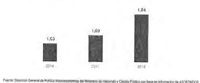
Gráfico 2. Retiros de Cesantías por desvinculación

Así las cosas, la presente iniciativa, si bien pretende el fomento de iniciativas de emprendimiento de los trabajadores del sector público y privado, desvirtúa el objetivo de las cesantías. Es recomendable que los trabajadores preserven estos recursos como un ahorro en horizontes de tiempo largos que pueden protegerlo en caso de quedar cesante; un escenario donde el afiliado sin ingresos laborales se encuentra más vulnerable.