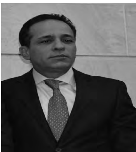
ALEXANDER LÓPEZ MAYA SEGUNDO VICEPRESIDENTE DEL HONORABLE SENADO DE LA REPÚBLICA,

Rueda Video en honor al Segundo Vicepresidente del Senado electo, honorable Senador Alexander López Maya: