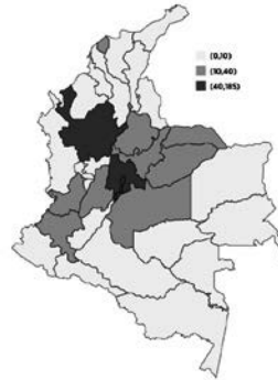
Mapa 8. Número de casos de violencia intrafamiliar. Total Casos 2020