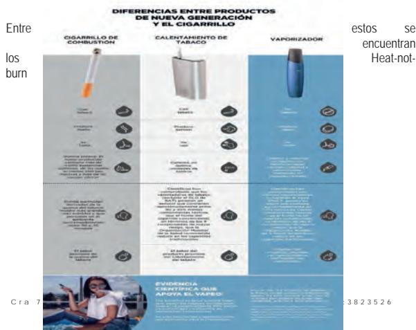
Ilustración 2.

(calentadores de tabaco), como se les llama en inglés, que llegaron al mercado mundial por primera vez en 1988, pero no fueron un éxito comercial 16 . Según la OMS "los productos de tabaco calentados kl(PTC) son productos de tabaco que producen aerosoles con nicotina y otras sustancias químicas y que liberan nicotina (contenida en el tabaco), una sustancia altamente adictiva. Además, contienen aditivos no tabáquicos y suelen estar aromatizados. Los PTC permiten imitar el hábito de fumar cigarrillos convencionales, y algunos utilizan cigarrillos diseñados específicamente para contener el tabaco que se calienta" 17 .