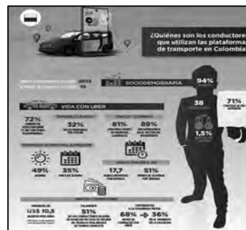
Fuente: Banco Interamericano de Desarrollo (BID). "¿Quiénes son los conductores que utilizan las plataformas de transporte en América Latina? Perfil de los conductores de Uber en Brasil, Chile, Colombia y México". Pág. 14.

Para la República de Colombia, se extrae la siguiente caracterización: