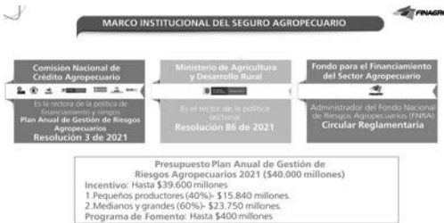
Gráfico 1.

"En los últimos años el Ministerio de Agricultura y Desarrollo Rural y la Comisión Nacional de Crédito Agropecuario -CNCA han impulsado el esquema del seguro agropecuario voluntario, adelantado diferentes acciones para su fortalecimiento y el aumento de su demanda, facilitando un marco legal estable, que fomente el desarrollo y el libre mercado de este ramo en el mercado asegurador, así como subsidiando un porcentaje del valor de la prima de las pólizas (prima neta + costos administrativos), permitiendo el acceso al subsidio a todos los cultivos, actividades pecuarias, acuícolas y forestales" 5 .