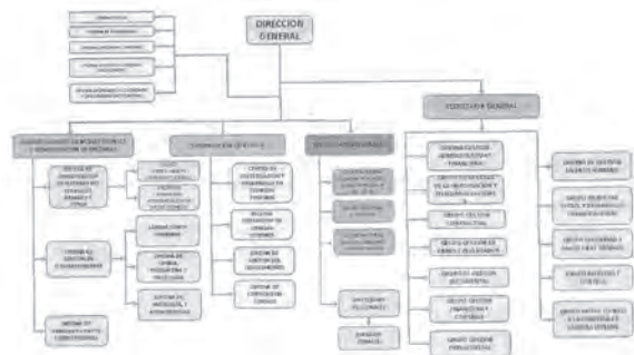
Gráfica 1. Organigrama del Instituto Nacional Técnico Científico de Ciencias Forenses