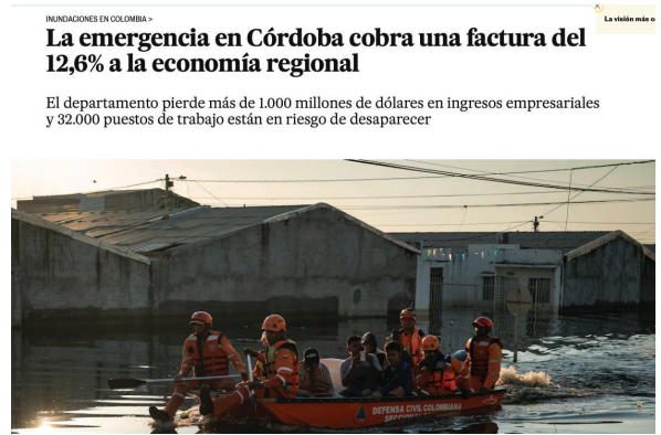
2. Imagen del país

La magnitud de la tragedia que aqueja al departamento de Córdoba y la subregión del Urabá ha sido ampliamente documentada por los principales medios de comunicación nacionales e internacionales.