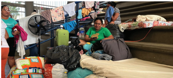
Emergencias en Córdoba

Las emergencias por inundaciones separaron a familias enteras y borraron hogares. Autoridades deben evitar ahora la propagación de enfermedades.