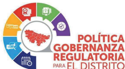
Imagen 1. Ciclo de la Política de Gobernanza Regulatoria

De conformidad con el Decreto Único Sectorial Sector Gestión Jurídica 479 de 2024, el objetivo de la Política de Gobernanza Regulatoria es promover el uso de herramientas y técnicas jurídicas, acciones de mejora normativa y buenas prácticas regulatorias para lograr que las normas expedidas en el Distrito Capital resulten eficaces, eficientes, transparentes, coherentes y simples, mediante un procedimiento estándar de alta calidad que promueva la seguridad jurídica. Por ello, la aplicación del Manual Distrital de Técnica Normativa deberá utilizarse en las etapas de diseño de la regulación y de la revisión de calidad de la norma.